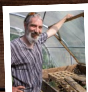
L'escargot du Florival Lautenbach-Zell

FOIE GRAS DE CANARD «TRADITION» 250G ENVIRON 151.50€ / KG