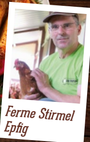
Ferme Stirmel Epfig

82-84 route de Neuf-Brisach, 68000 COLMAR